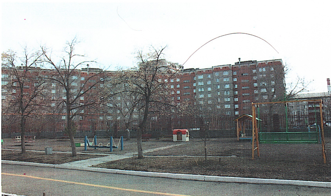
Детская площадка (фото № 9)

Управленческое решение п.4 паспорта доступности №1 объекта социальной инфраструктуры